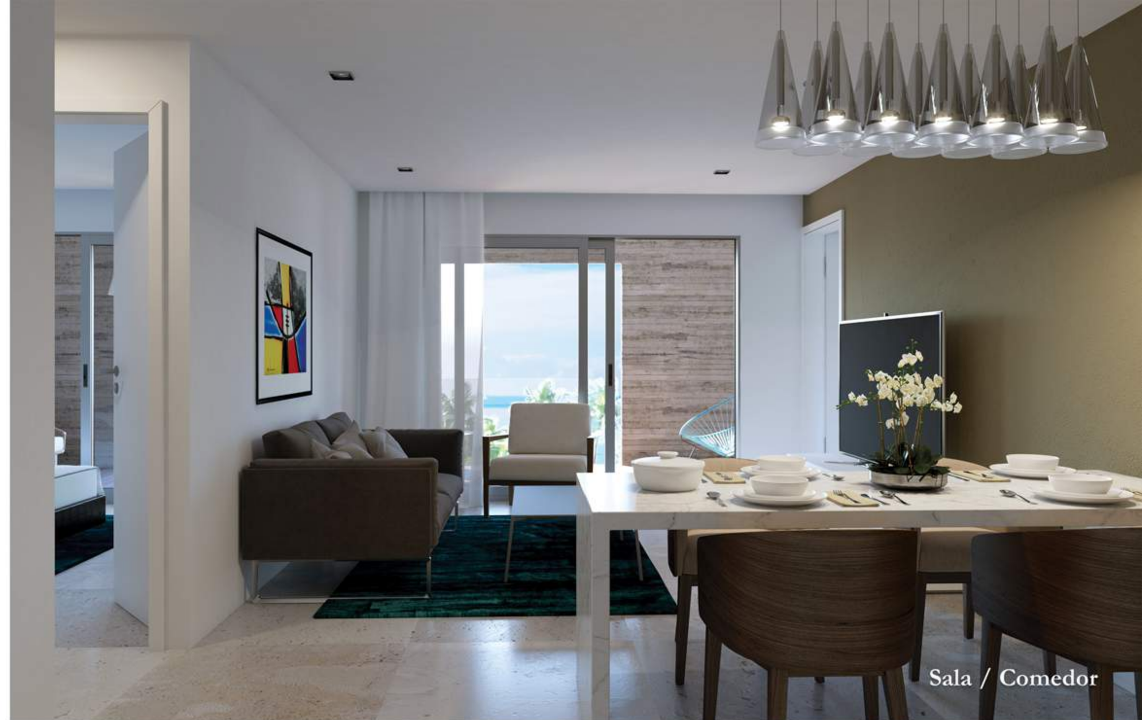
Sala / Comedor

*Las imágenes mostradas son ilustrativas y el proyecto final puede tener variaciones, el desarrollador no se responsabiliza de los cambios que pueda sufrir el proyecto.