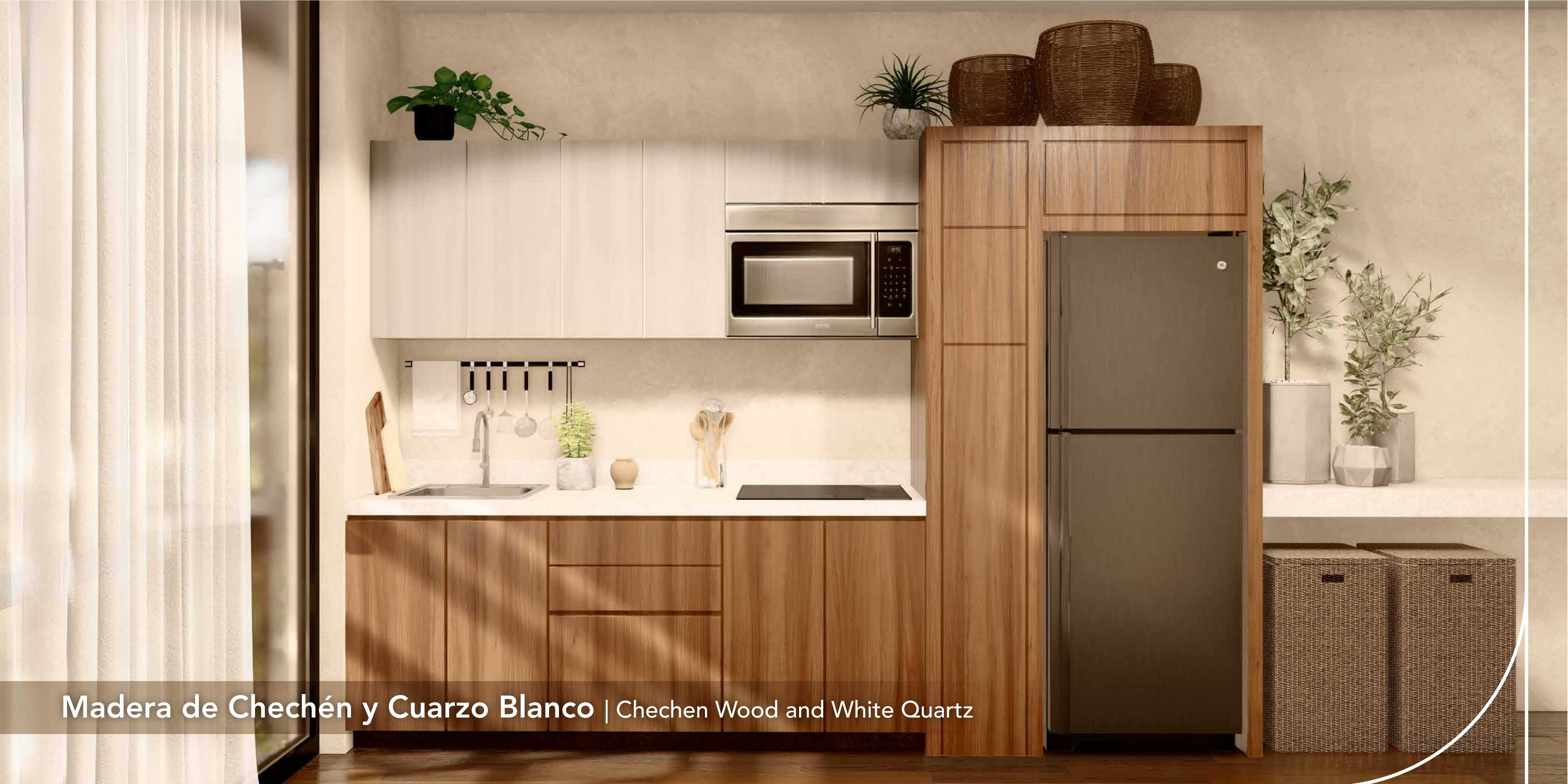
Madera de Chechén y Cuarzo Blanco | Chechen Wood and White Quartz