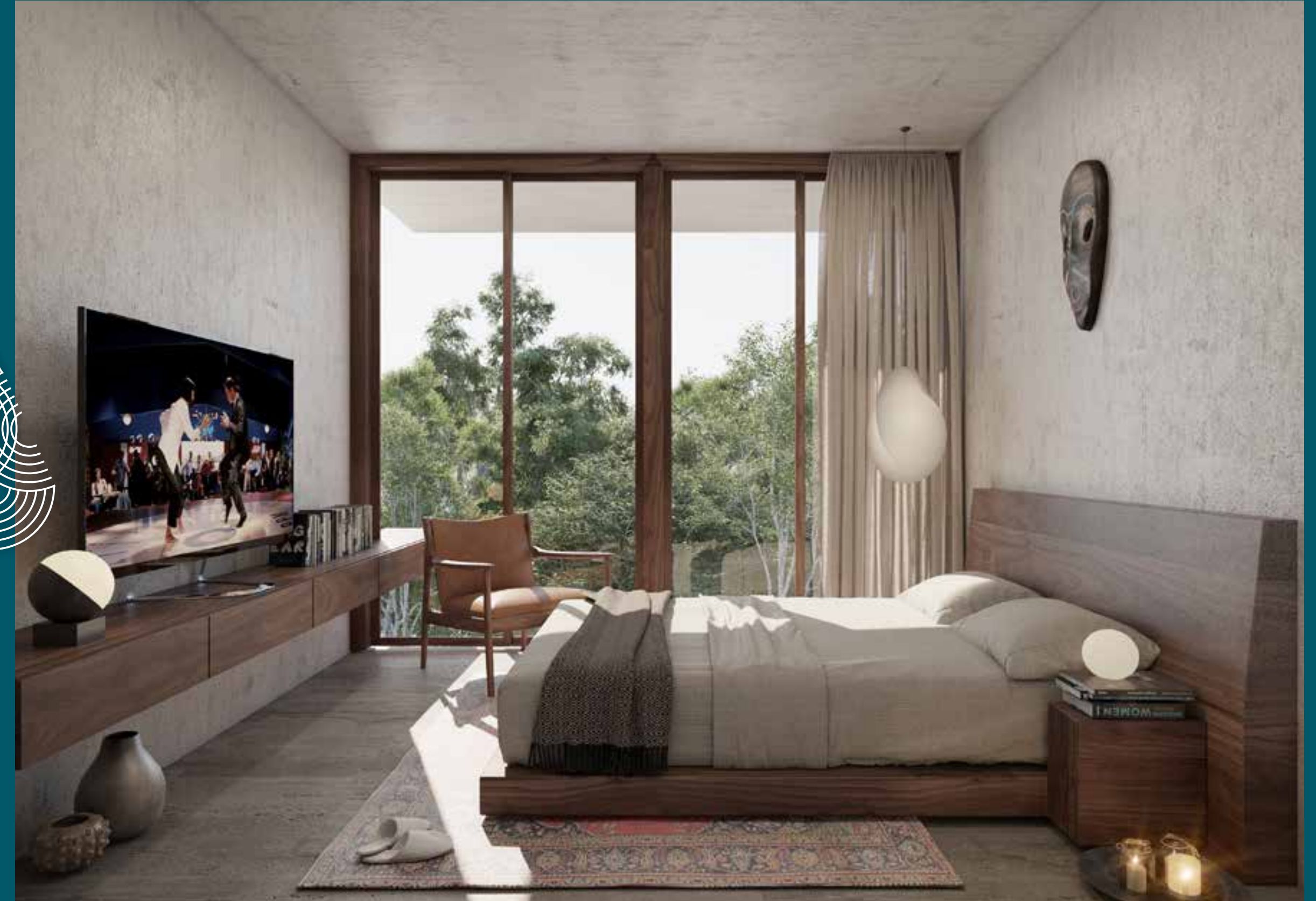
GARDEN HOUSES 2 HAB - 3 HAB