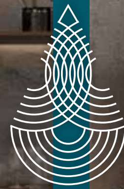
CONDOMINIOS 2 HAB - 3 HAB