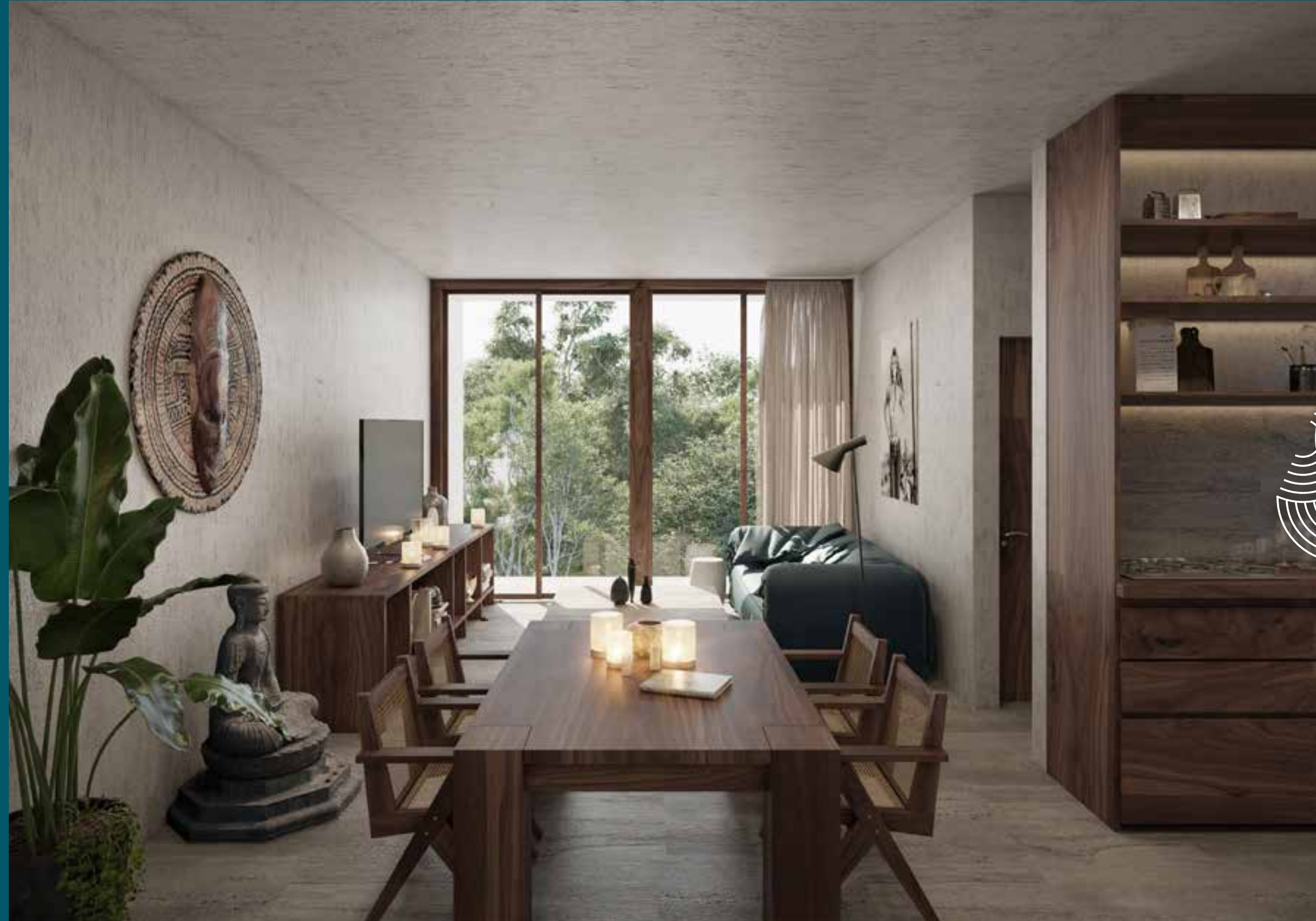
ESTUDIOS 1 HAB