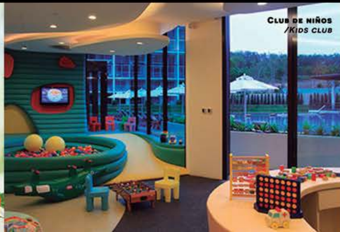
CLUB DE NIÑOS /KIDS CLUB