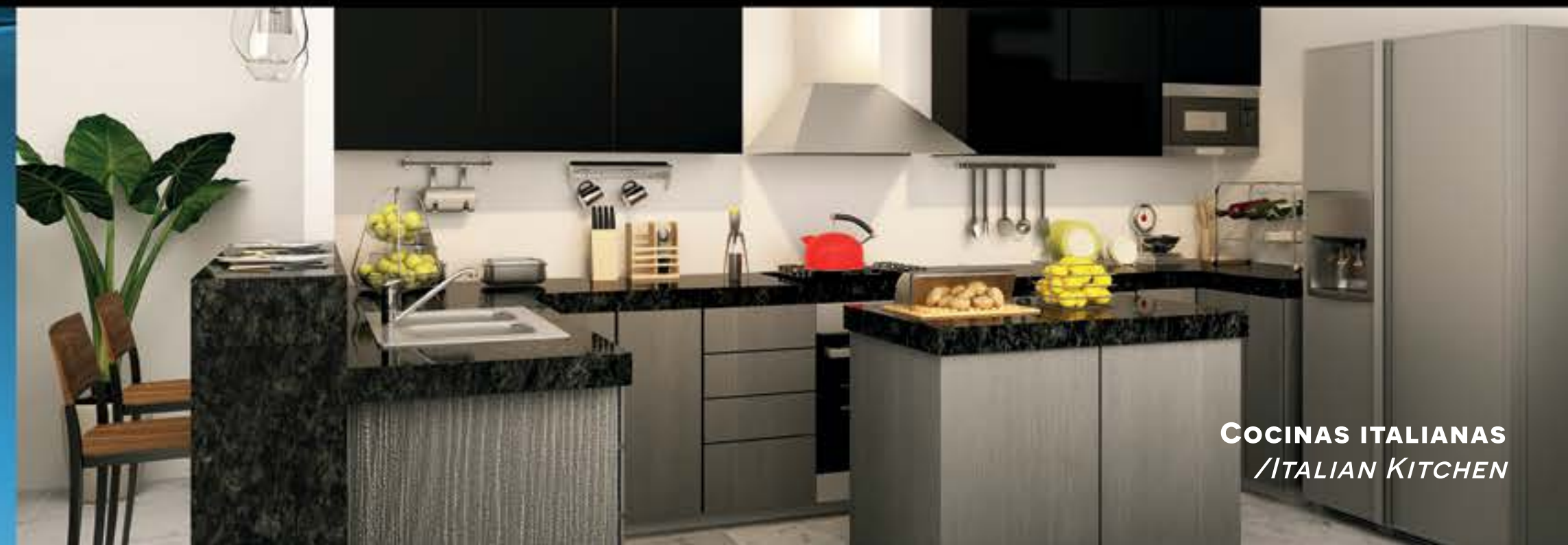
COCINAS ITALIANAS /ITALIAN KITCHEN