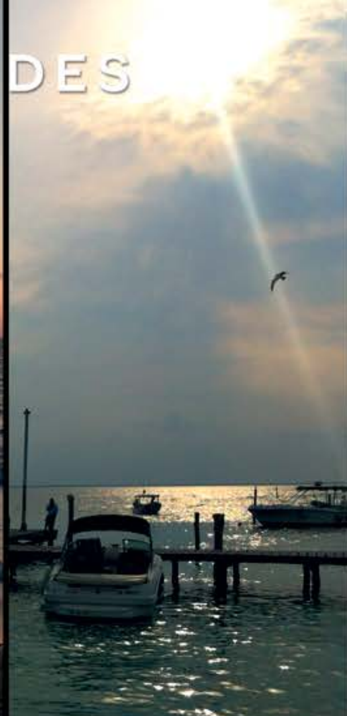
MARINA / MARINA