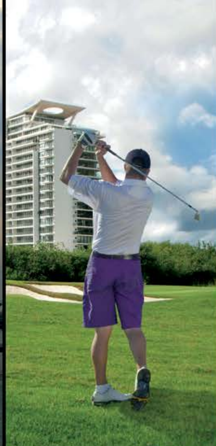
CAMPO DE GOLF / GOLF COURSE