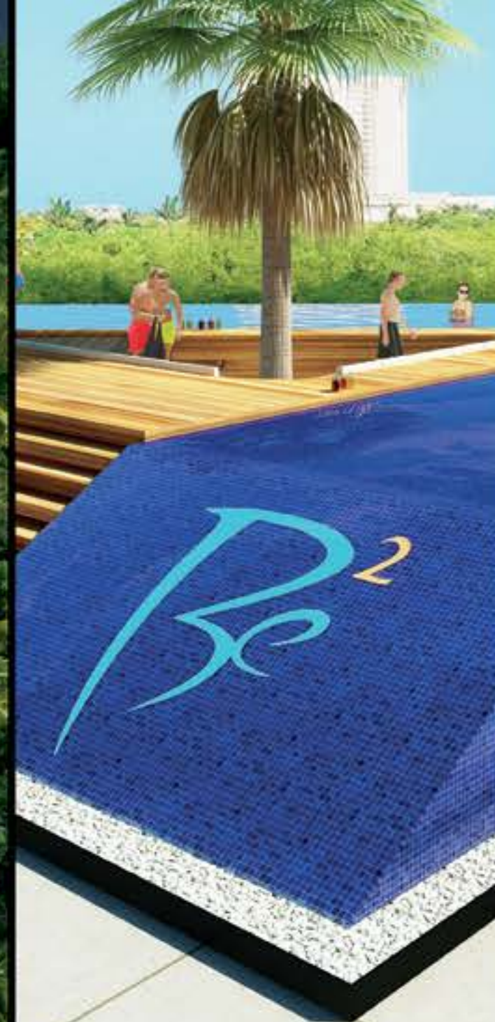
ALBERCA PARA ADULTOS / ADULT POOL