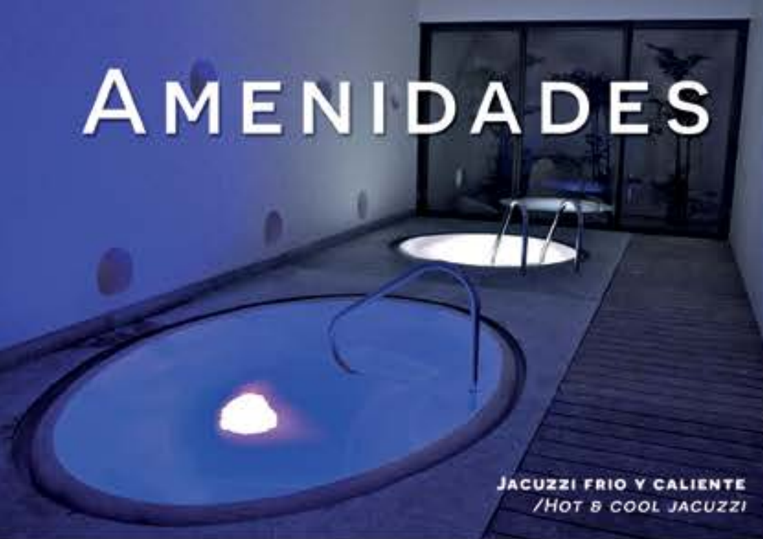
JACUZZI FRIO Y CALIENTE /HOT & COOL JACUZZI