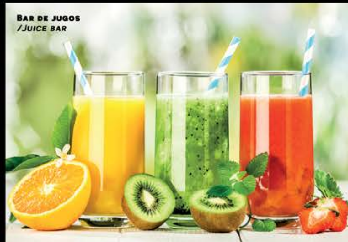
BAR DE JUGOS /JUICE BAR