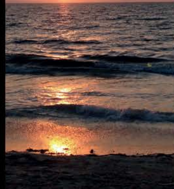
PLAYA / BEACH