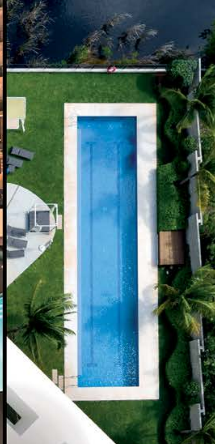
TRACK DE NADO / CANAL POOL