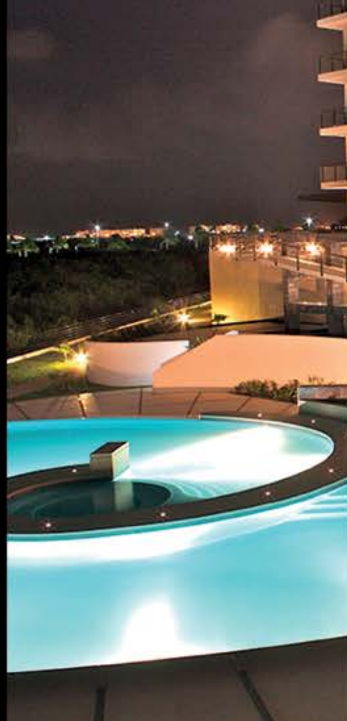
ALBERCA FAMILIAR / FAMILY POOL