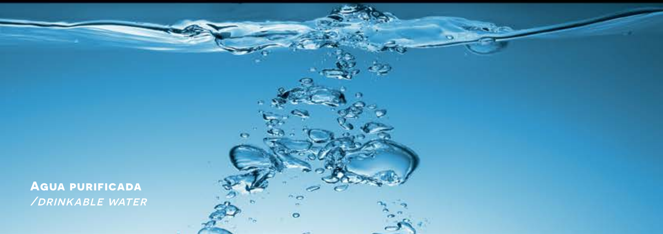
AGUA PURIFICADA /DRINKABLE WATER

Cooking equipment: Teka Brand, includes three speed hood, 5 burner grill, two functions oven, stainless steel double sink and mixer taps.