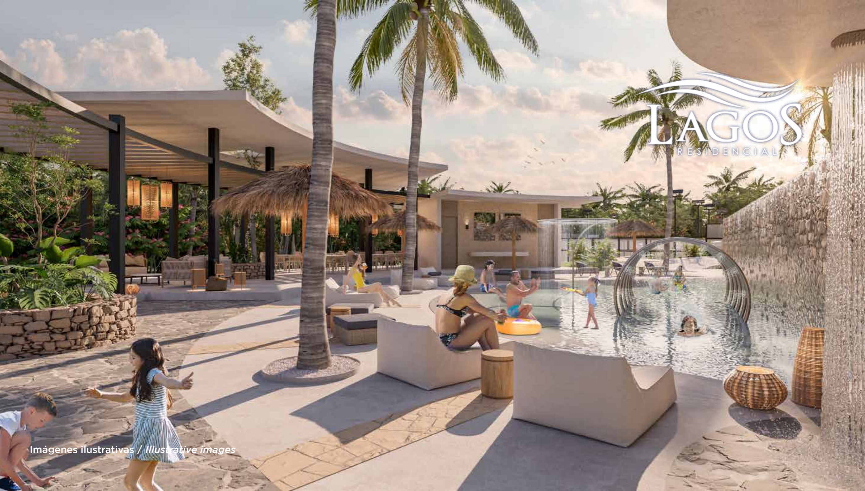
Imágenes ilustrativas / Illustrative images