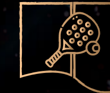
CANCHAS DE PADDLE