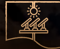
SOLAR PANEL ENERGY SYSTEM