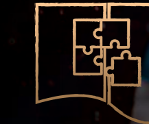
KIDS CLUB & PLAYGROUND