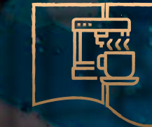
COFFE & SNACK BAR