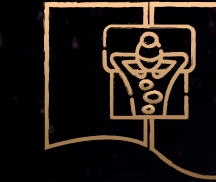
SPA & WELNESS