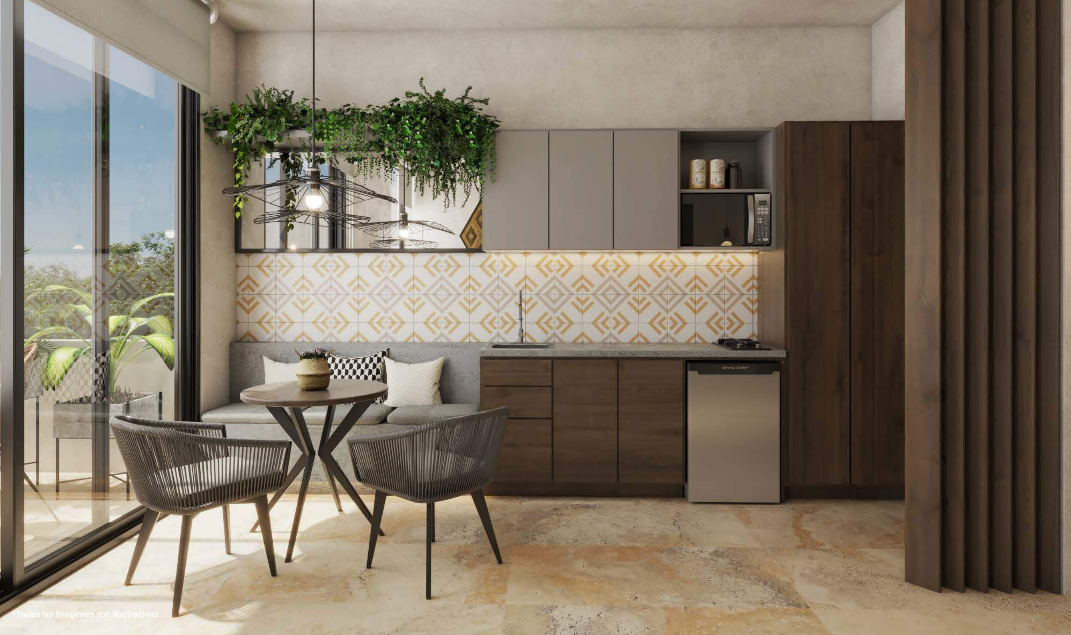
*Todas las imágenes son ilustrativas