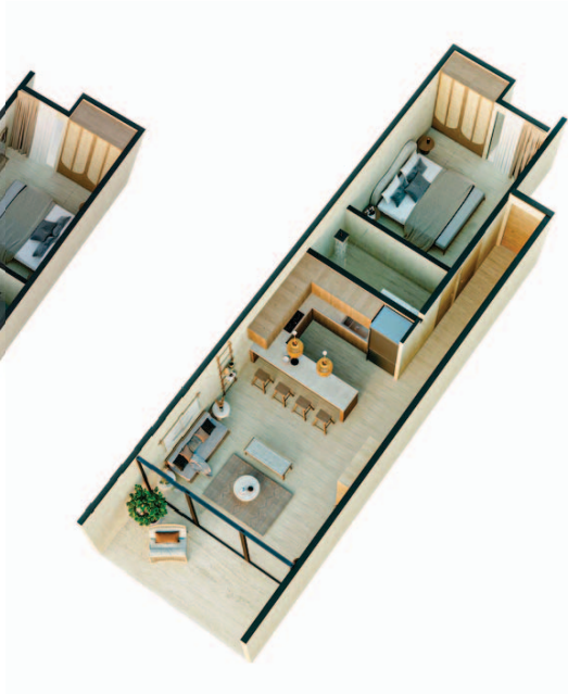
1 Bedroom Jungle View