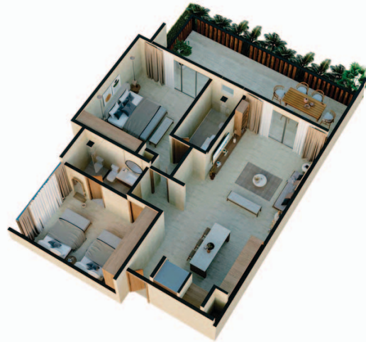
2 Bedrooms Garden Jungle View