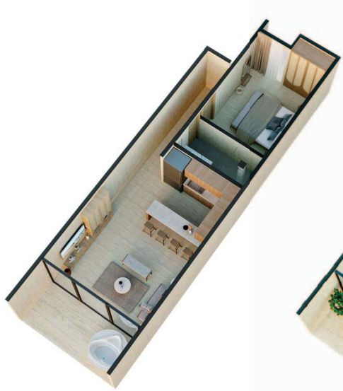
1 Bedroom Pool View