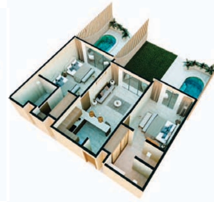
2 Bedrooms Garden LO