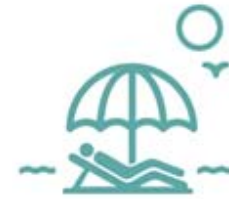
Club de playa