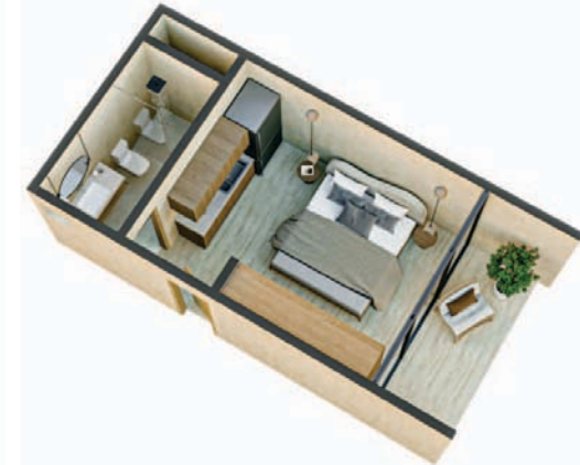
Studio Jungle View