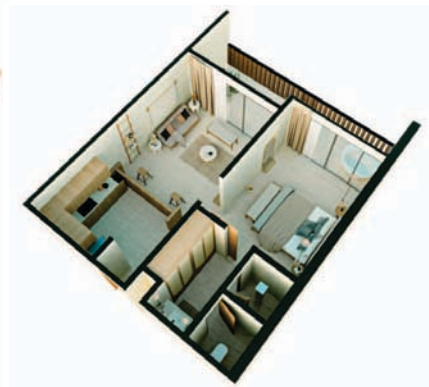
1 Bedroom Living