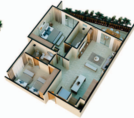
2 Bedrooms Jungle View