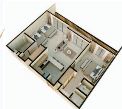
2 Bedrooms Living LO