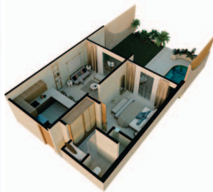
1 Bedroom Garden