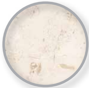
PISOS DE MÁRMOL