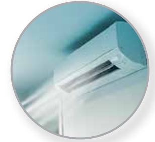
AIRES ACONDICIONADOS INVERTER