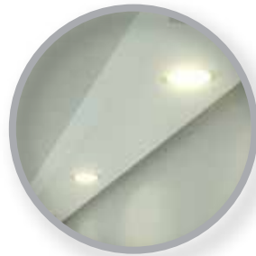
PLAFONES CON LUZ INDIRECTA