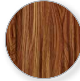
TERMINACIONES DE CALIDAD