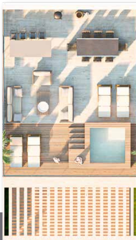
TIPO PH 1 151.3 M2