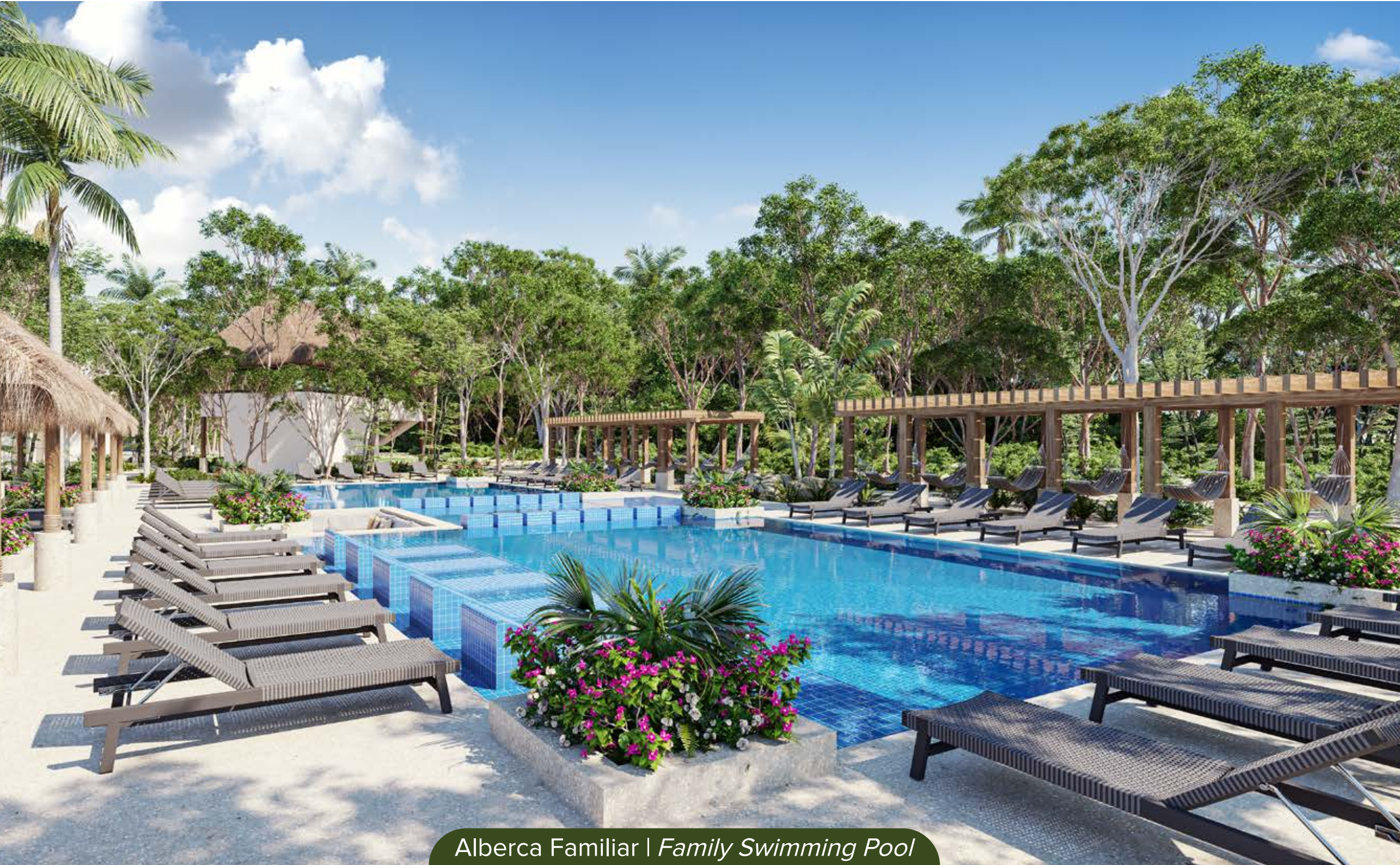
Alberca Familiar | Family Swimming Pool