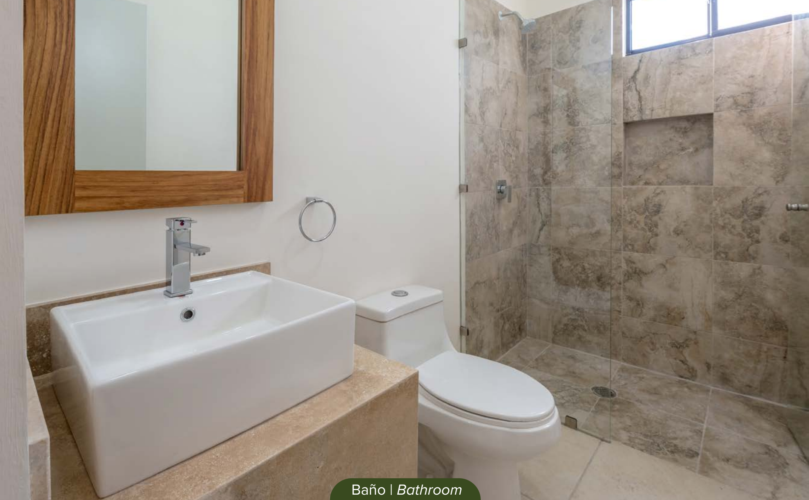
Baño | Bathroom