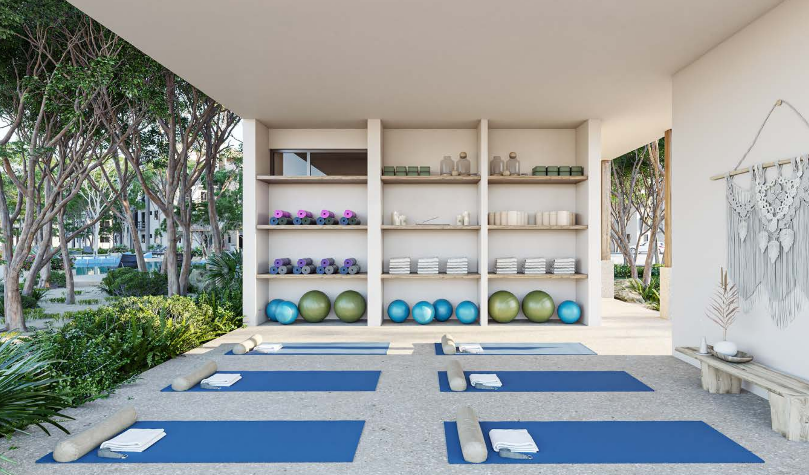
Área de Yoga | Yoga Area