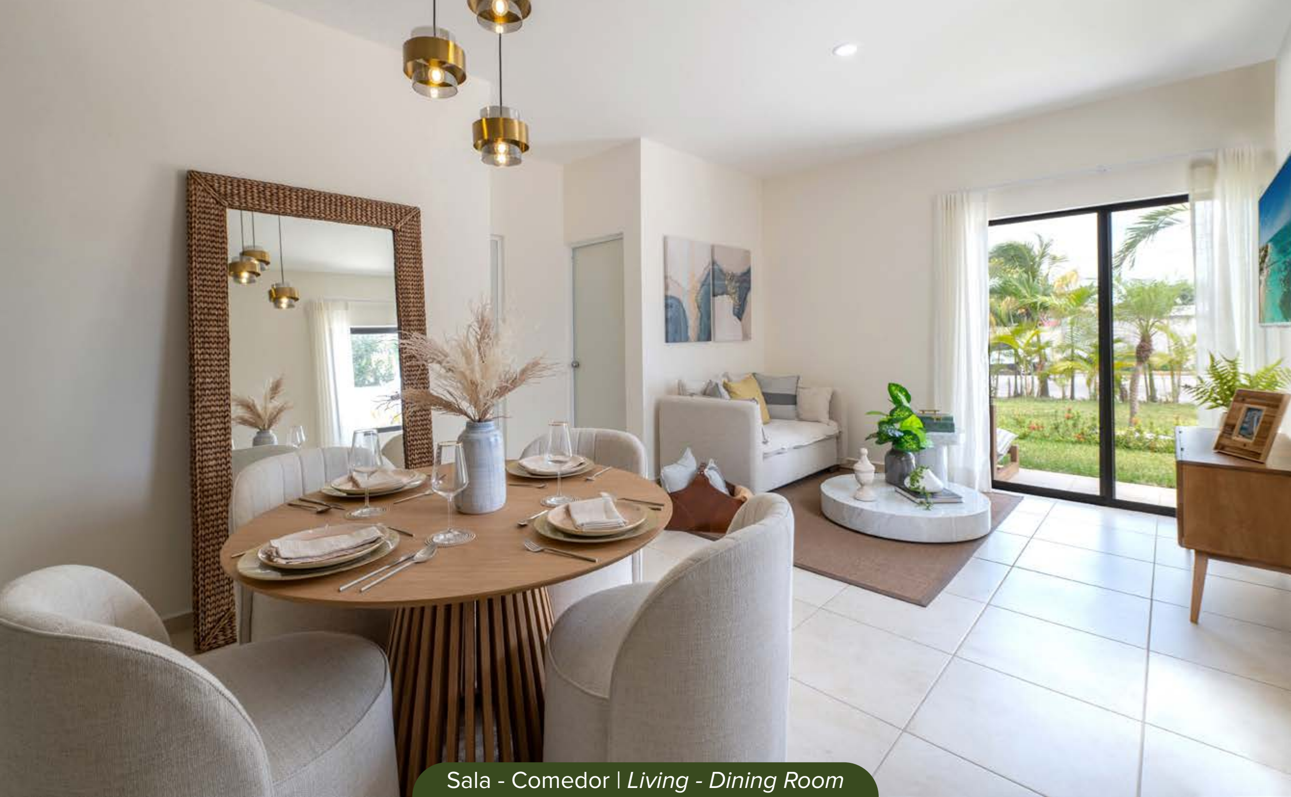
Sala - Comedor | Living - Dining Room