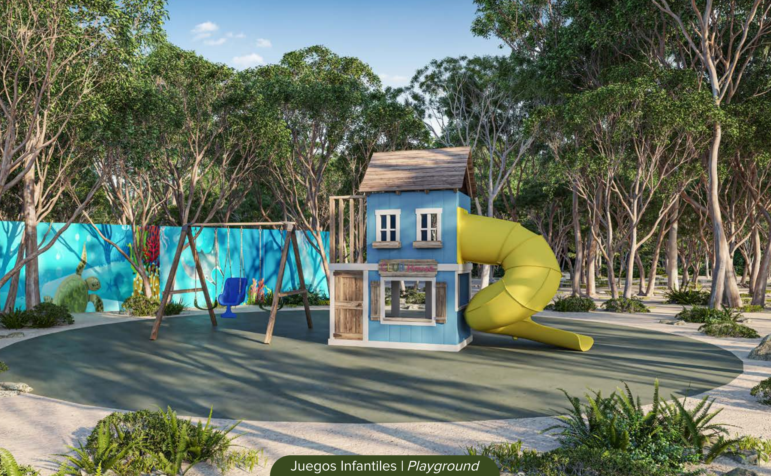
Juegos Infantiles | Playground