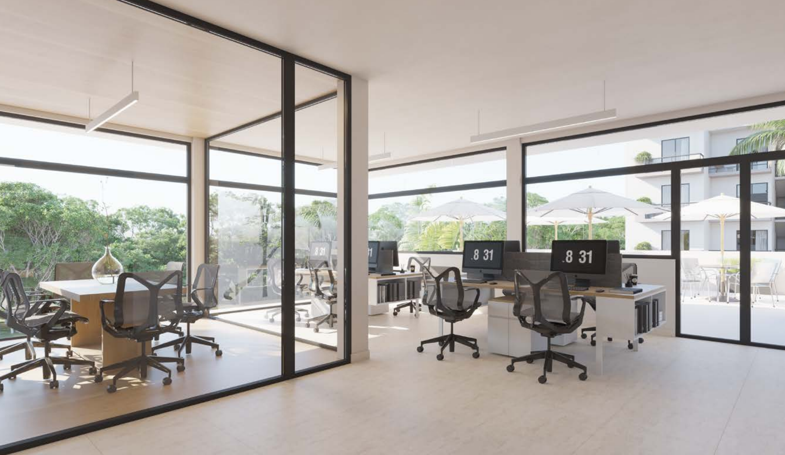
Coworking | Coworking Space