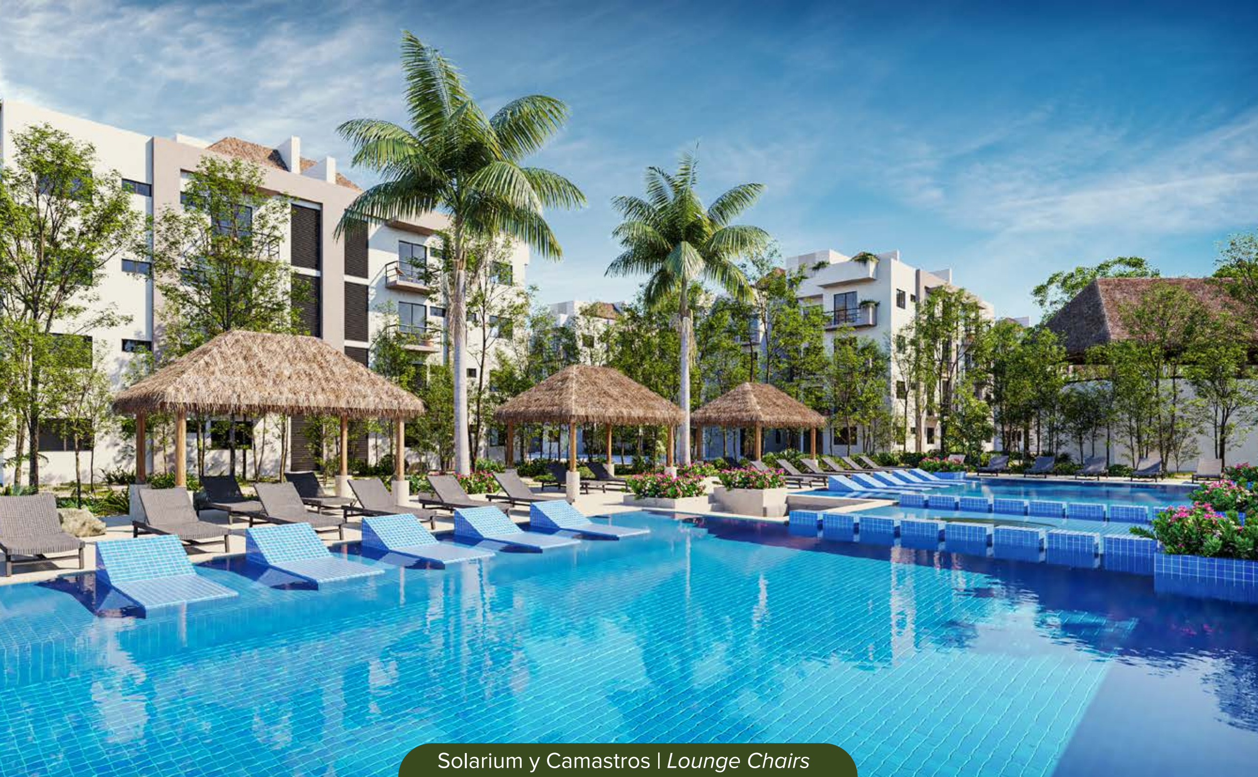
Solarium y Camastros | Lounge Chairs