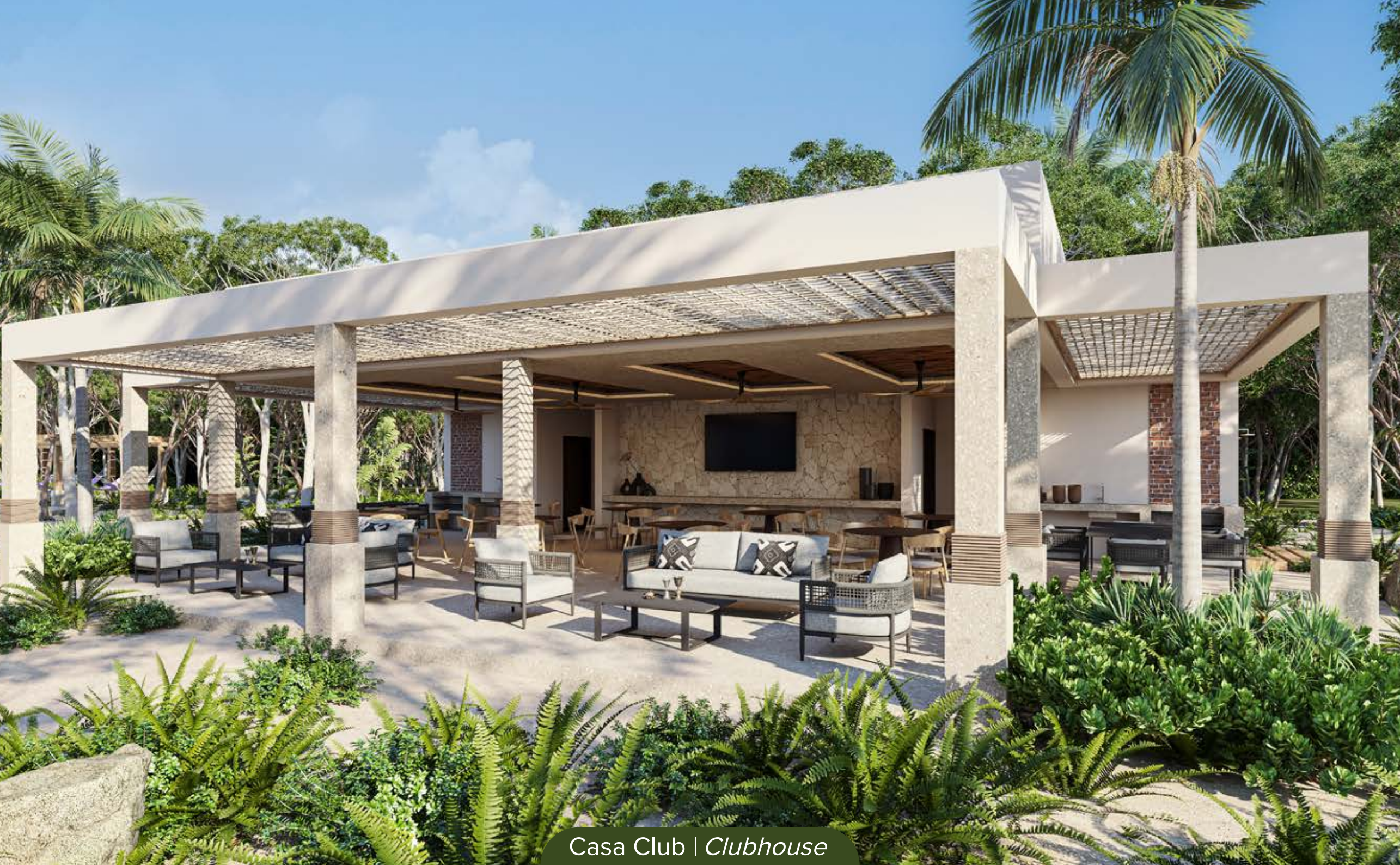
Casa Club | Clubhouse