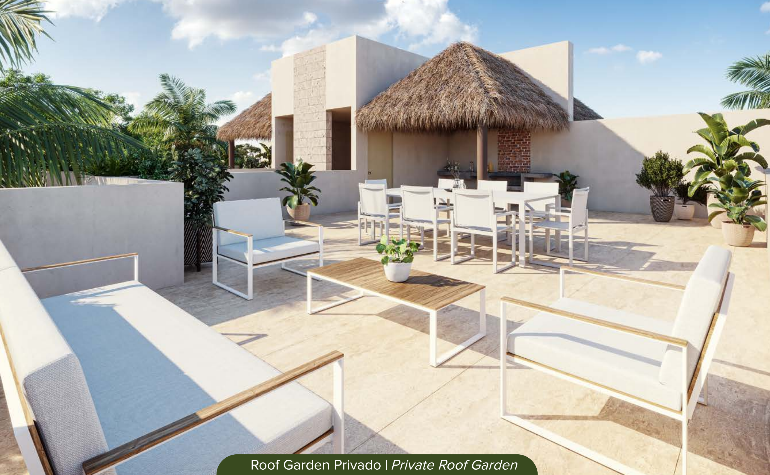
Roof Garden Privado | Private Roof Garden