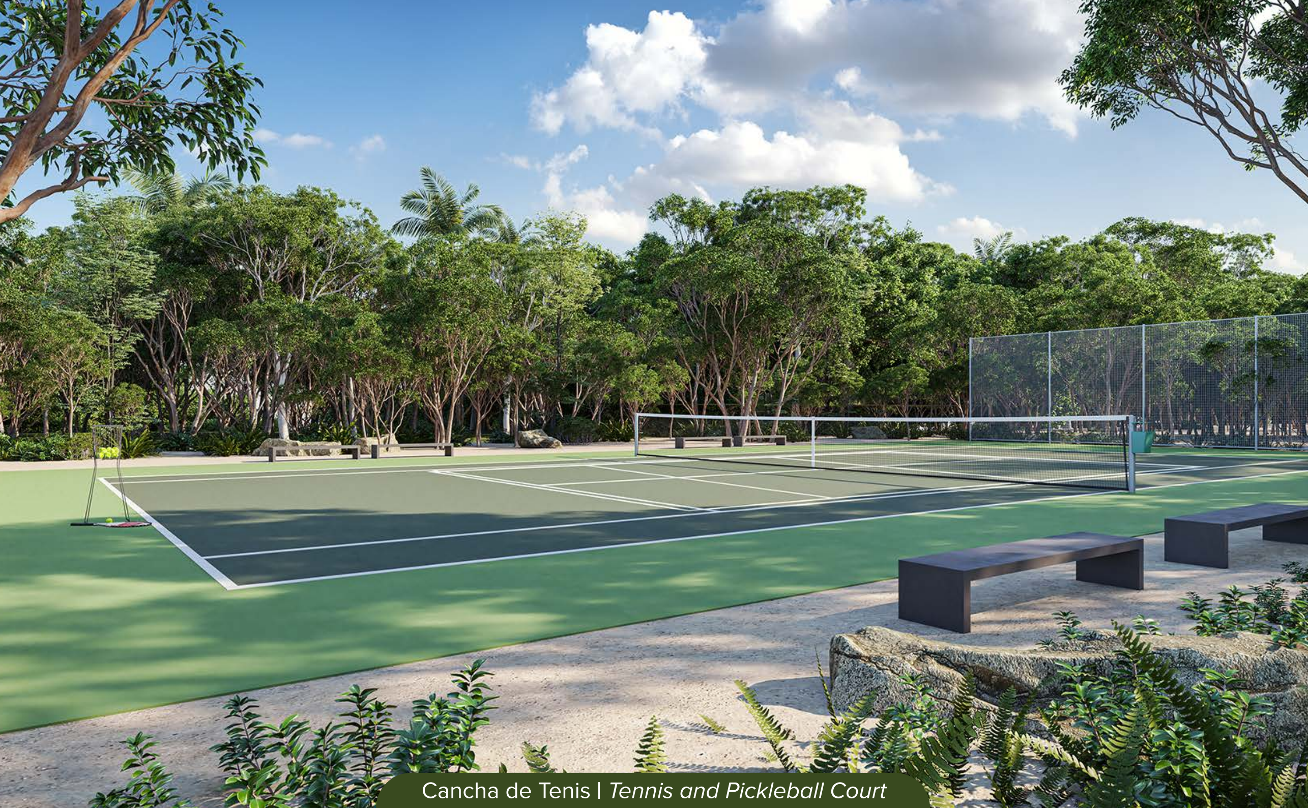
Cancha de Tenis | Tennis and Pickleball Court