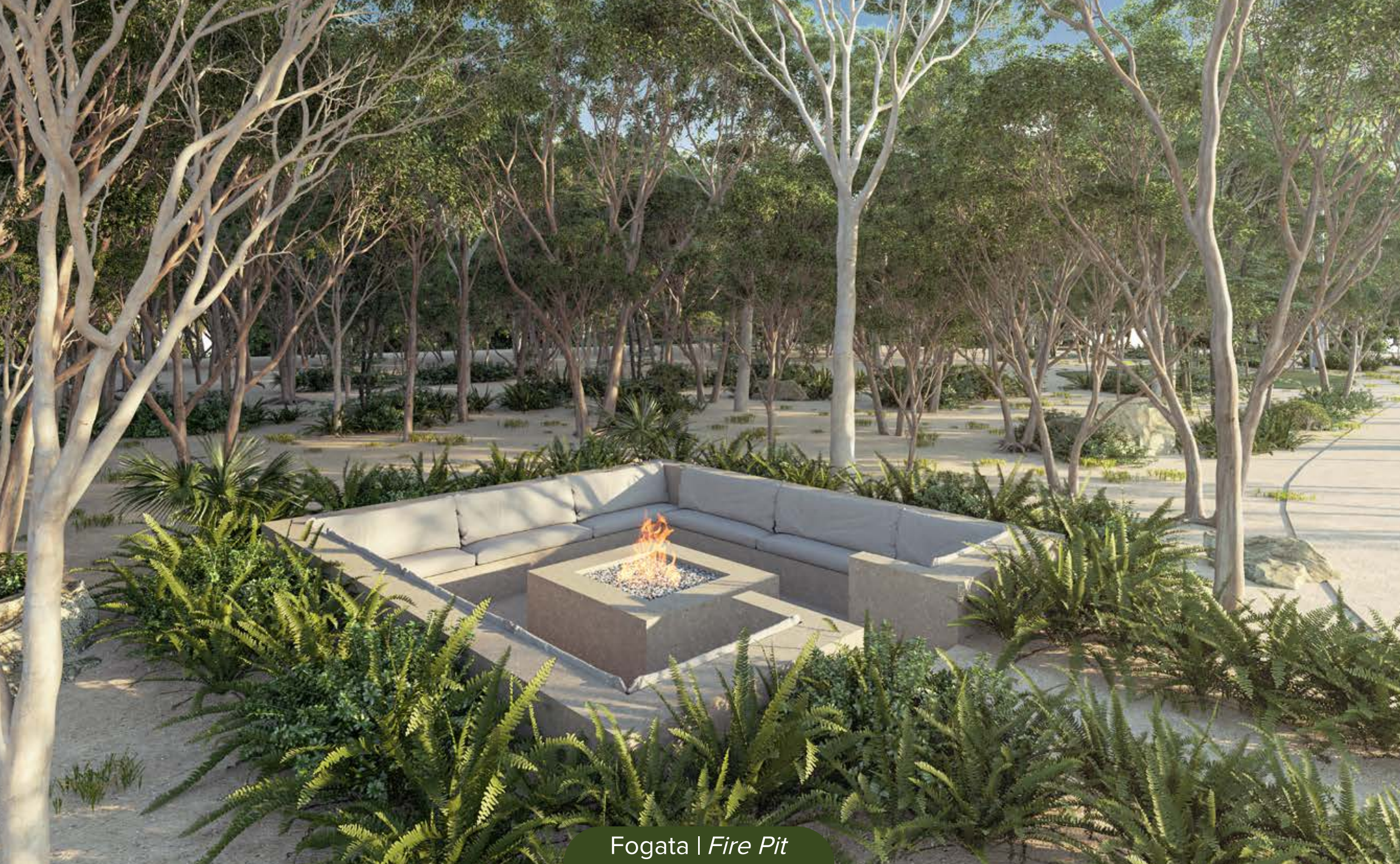
Fogata | Fire Pit