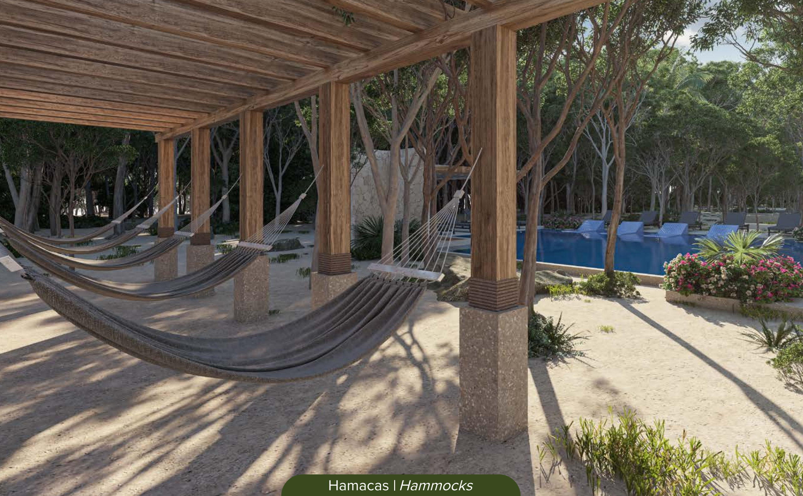
Hamacas | Hammocks