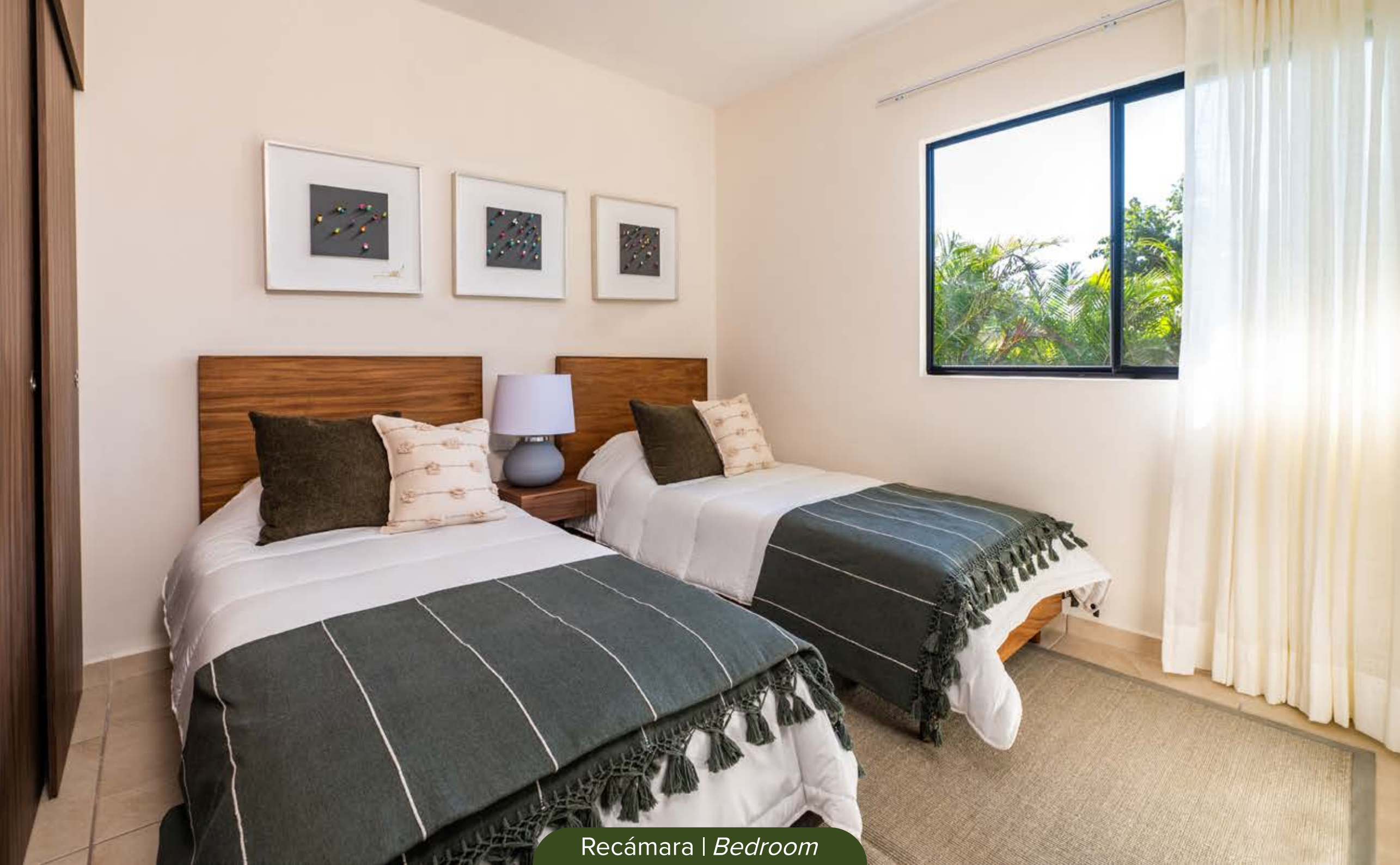
Recámara | Bedroom