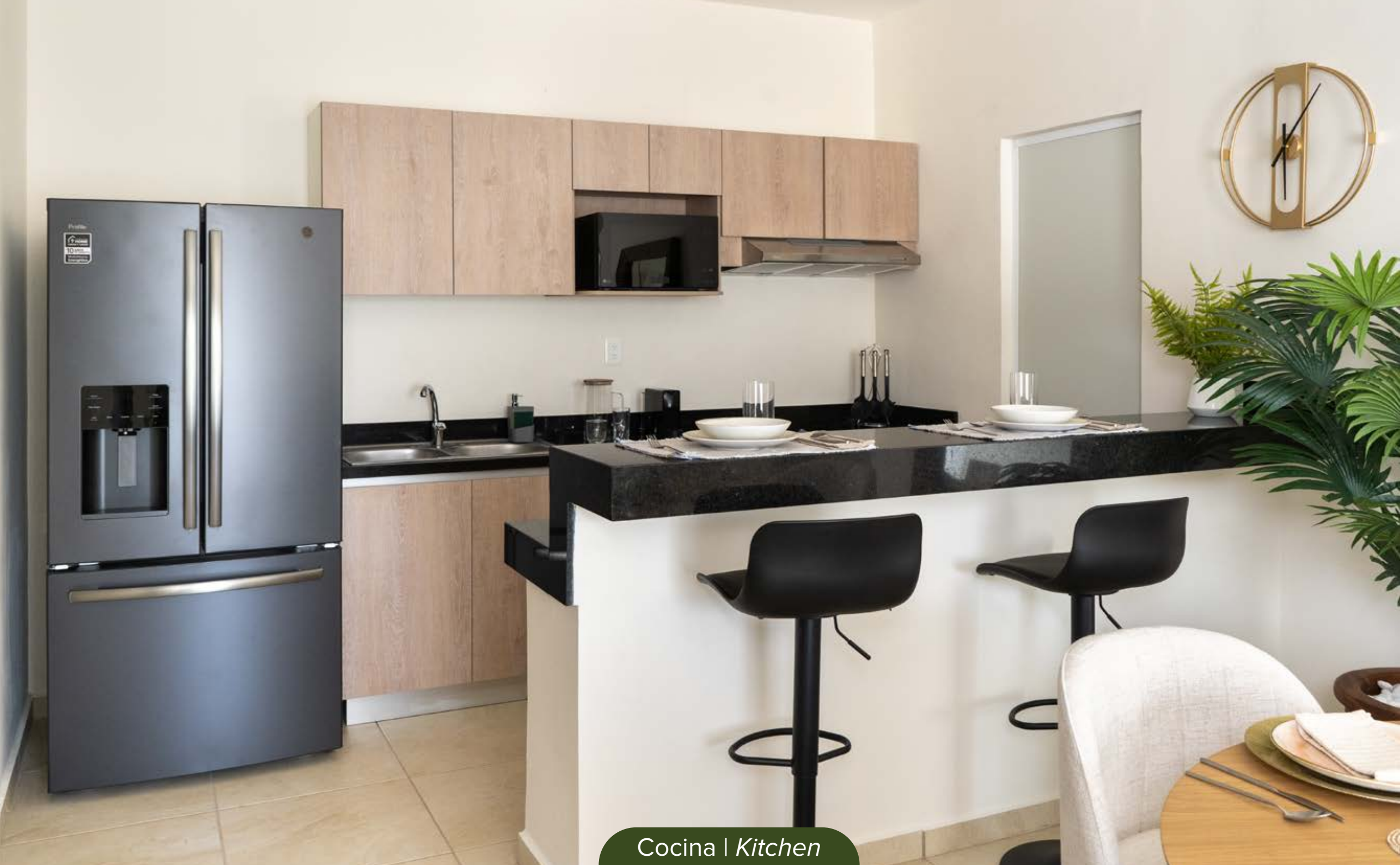
Cocina | Kitchen