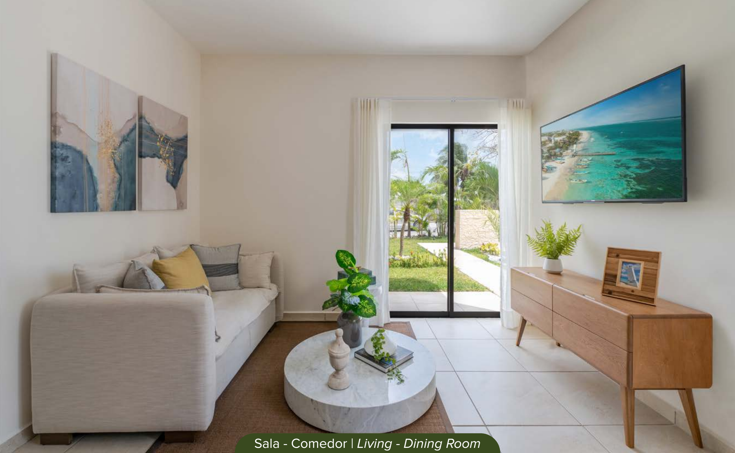
Sala - Comedor | Living - Dining Room