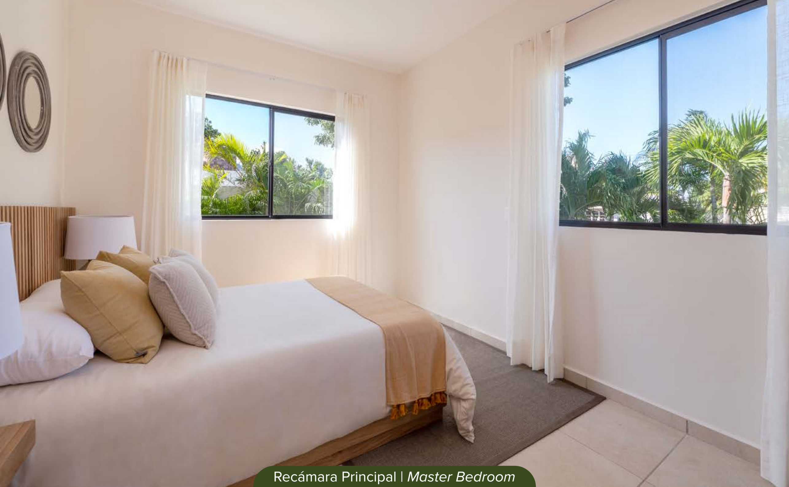
Recámara Principal | Master Bedroom