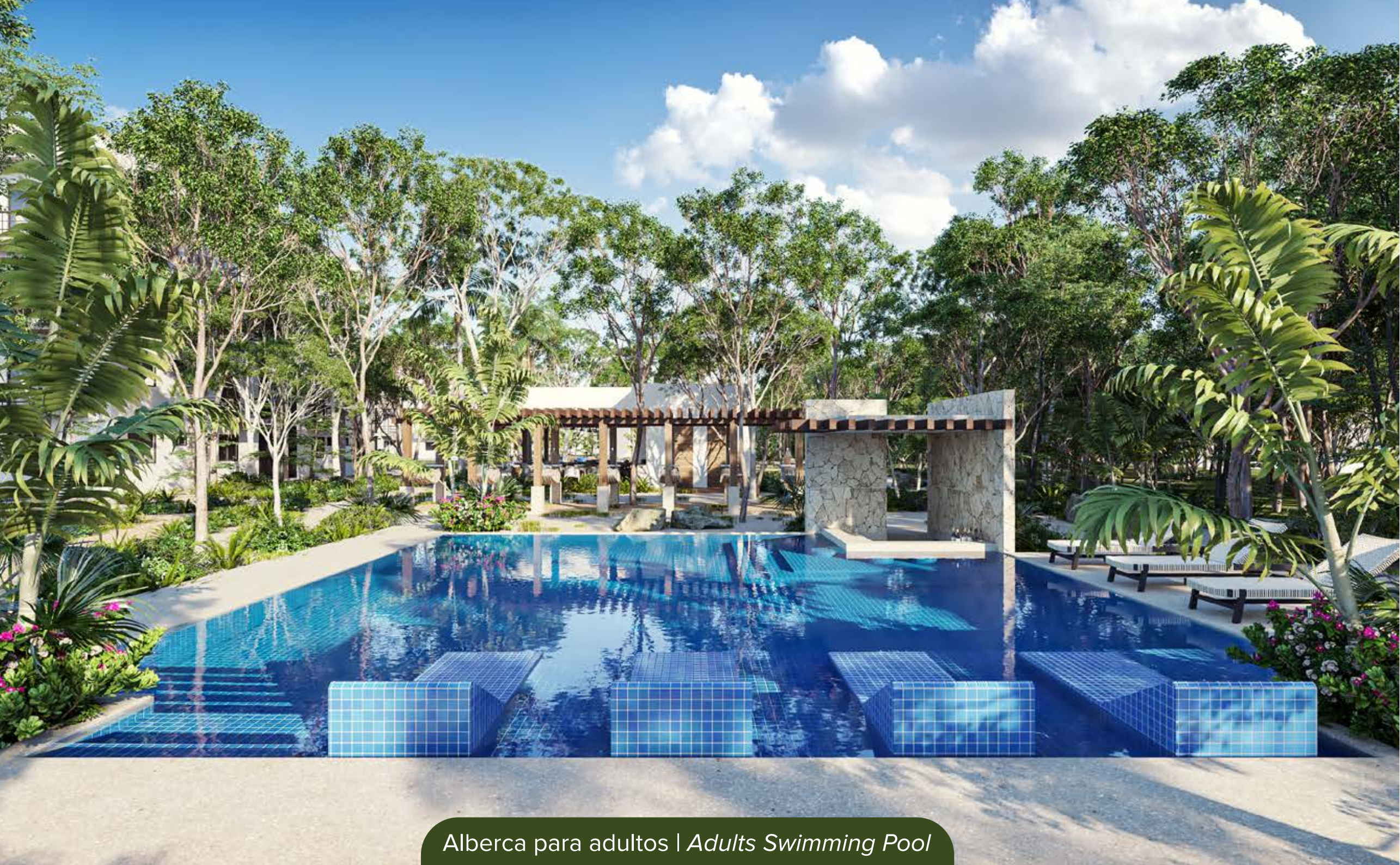
Alberca para adultos | Adults Swimming Pool