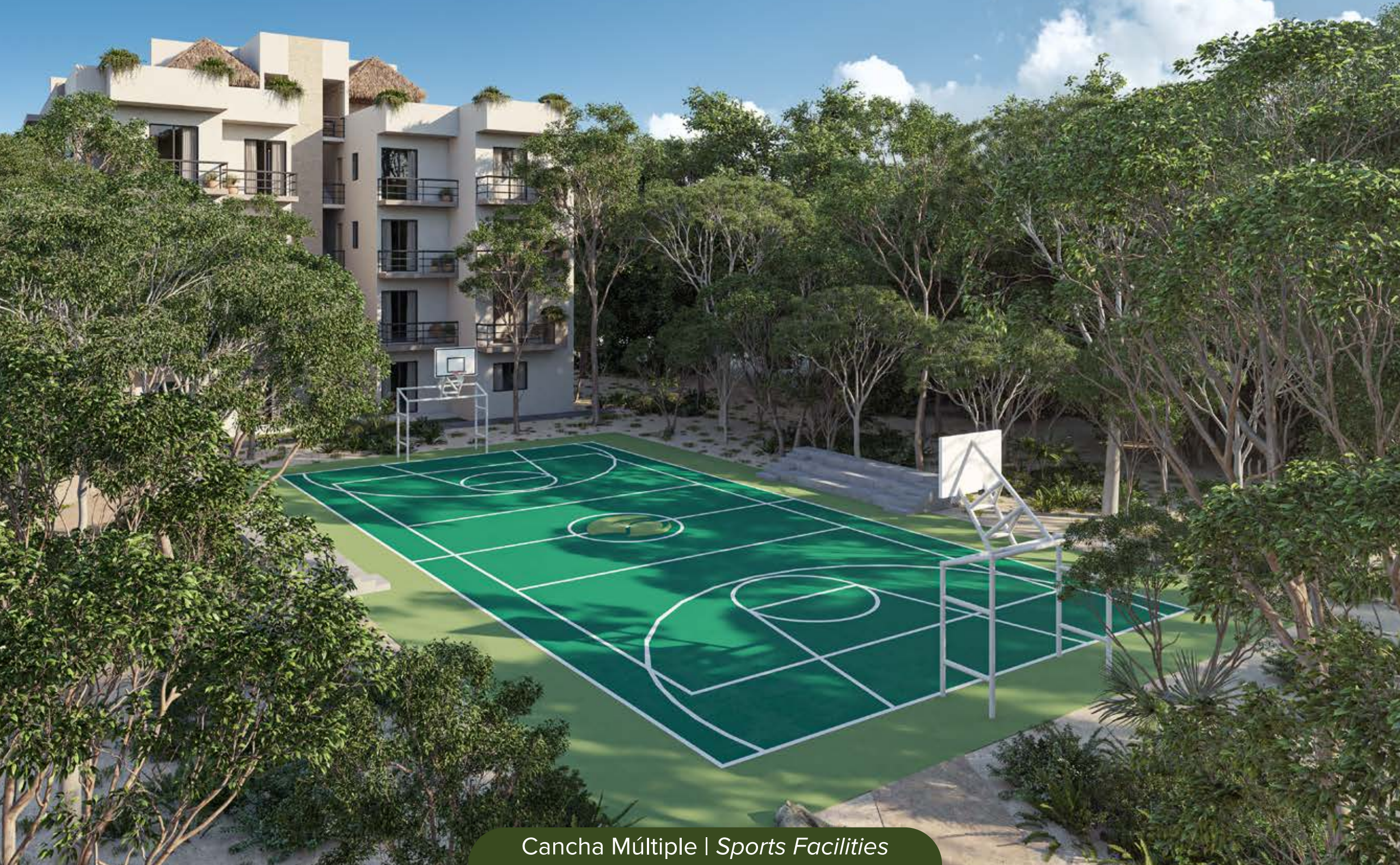
Cancha Múltiple | Sports Facilities