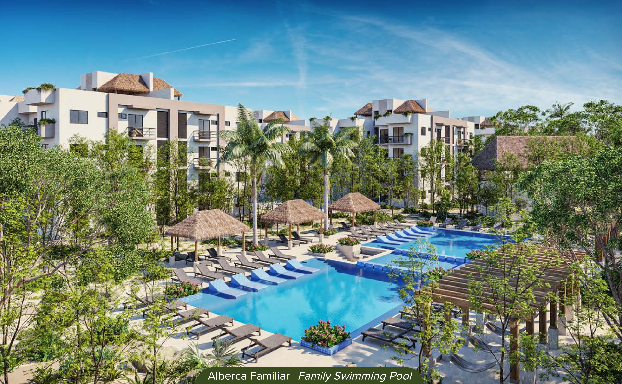
Alberca Familiar | Family Swimming Pool