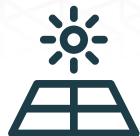
PANELES SOLARES SOLAR PANELS